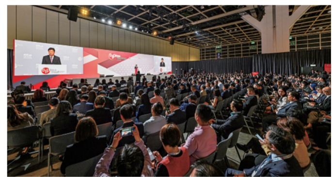
▲亚洲知识产权营商论坛开幕式