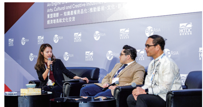
▲香港特区政府知识产权署与东南亚国家联盟秘书处合办东盟环节