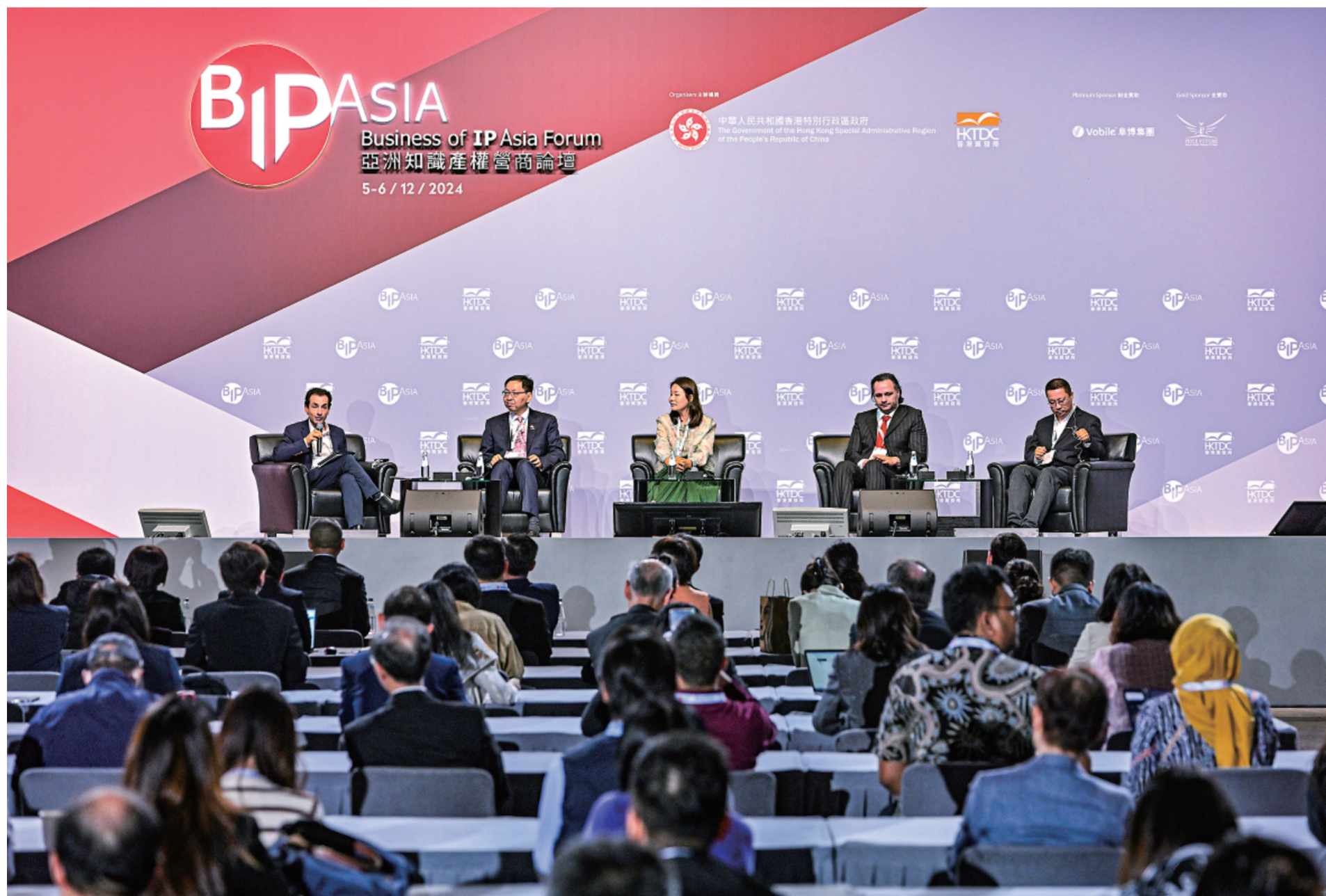
▲香港特区政府知识产权署与世界知识产权组织合办分论坛

展望未来，香港将继续充分发挥区域优势，更加深度融入国家发展大局，积极参与粤港澳大湾区在知识产权领域的合作与建设，致力推动知识产权相关的创新发展和实践，从而提供更好的投资与贸易环境，并积极深化与东盟地区的合作交流，进一步增强在亚太地区和全球的知识产权影响力。